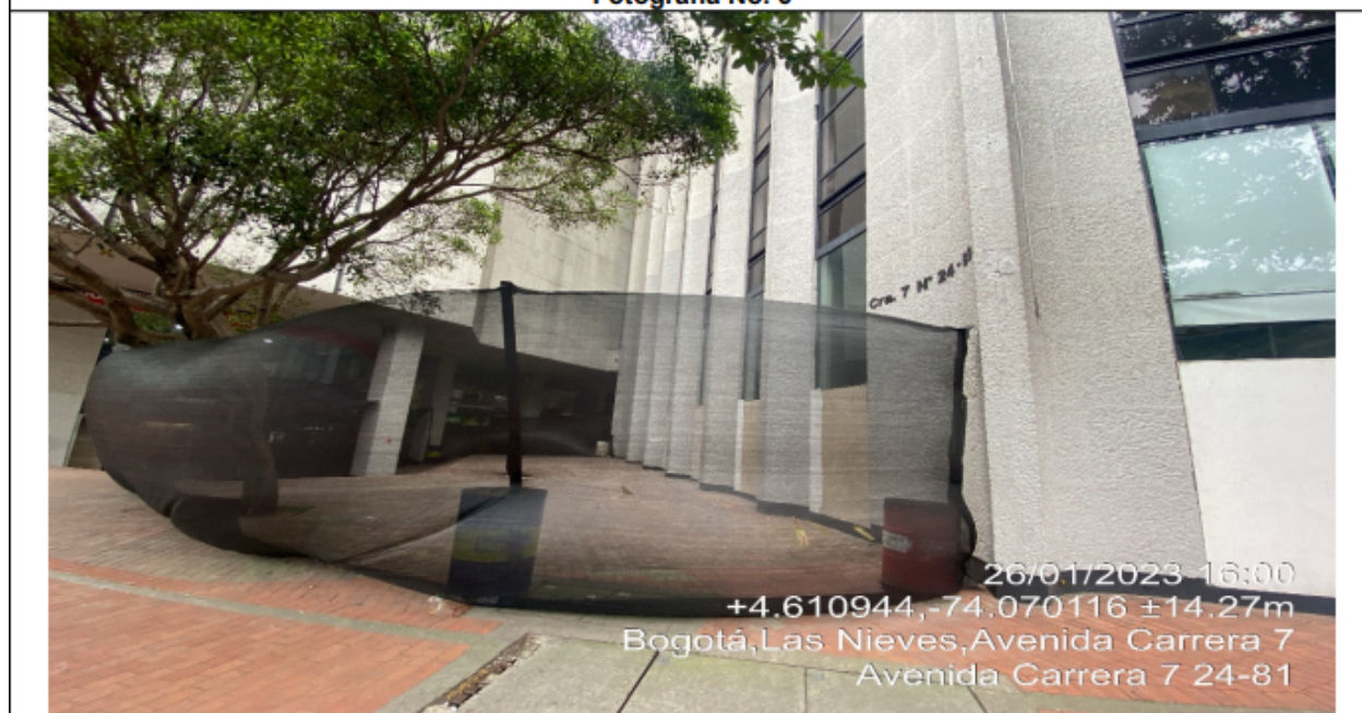
Fotografía No. 6

En la cual se observa la vista panorámica de la cara nororiental del primer nivel de la edificación, donde se evidencia el retiro de los elementos de publicidad exterior visual adicionales.