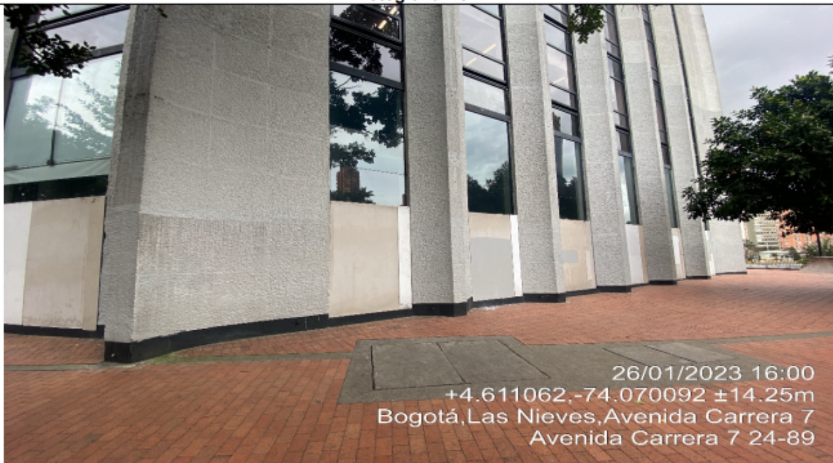
Fotografía No. 7

En la cual se observa la vista panorámica de la cara noroccidental del primer nivel de la edificación, donde se evidencia el retiro de los elementos de publicidad exterior visual adicionales.