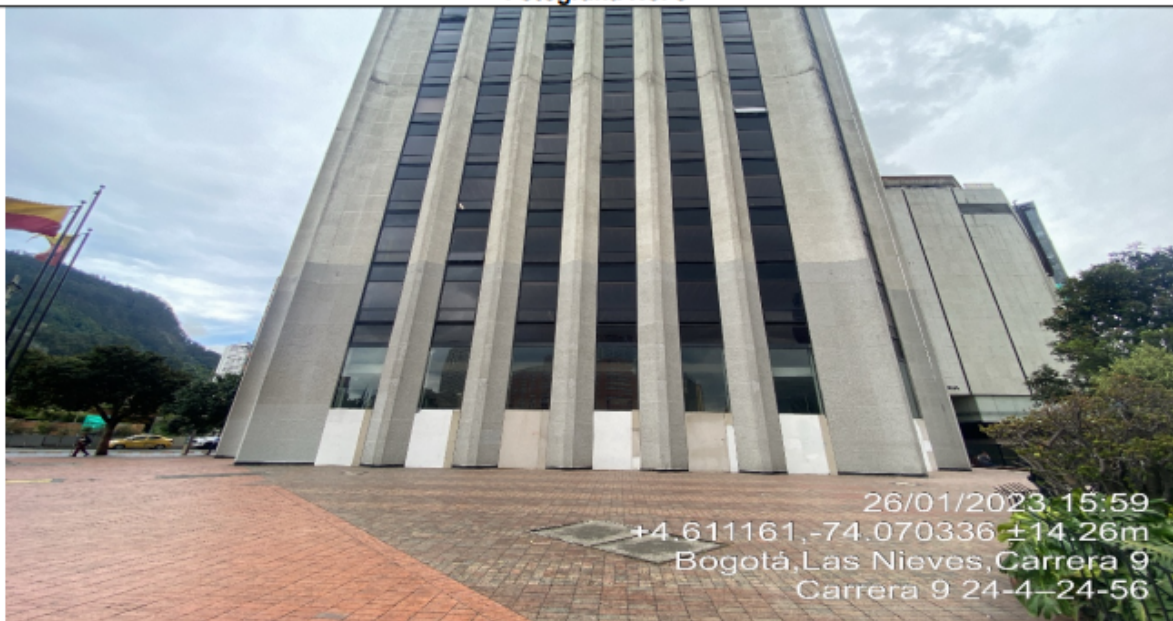
Fotografía No. 8

En la cual se observa la vista panorámica de la cara suroccidental del primer nivel de la edificación, donde se evidencia el retiro de los elementos de publicidad exterior visual adicionales.