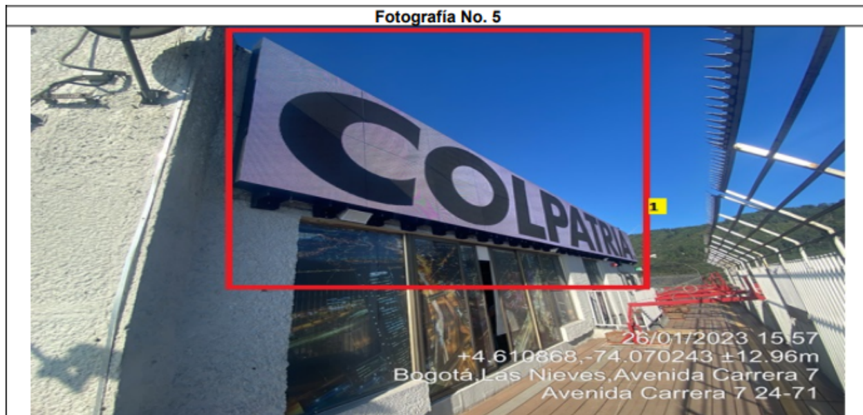
Fotografía No. 5

En la cual se evidencia un elemento tipo aviso en fachada ubicado en la parte superior de la cara Sur Oriental del edificio Torre Colpatría P.H. perteneciente a la propiedad horizontal EDIFICIO COLPATRIA PH , el cual al momento de la visita se encontraba instalado sin el registro ante la SDA y para el cual se hizo la solicitud de registro con radicado inicial SDA No. 2022ER52897 del 14 de marzo de 2022.