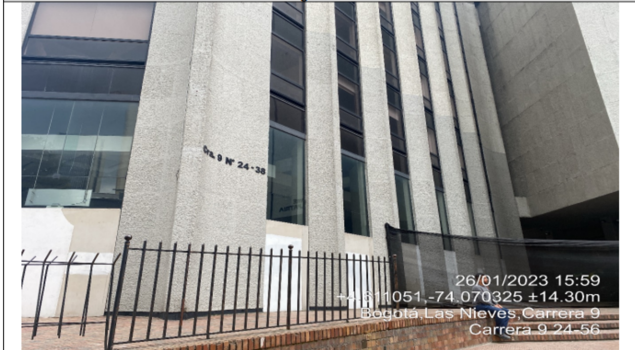
Fotografía No. 9

En la cual se observa la vista panorámica de la cara suroriental del primer nivel de la edificación, donde se evidencia el retiro de los elementos de publicidad exterior visual adicionales.